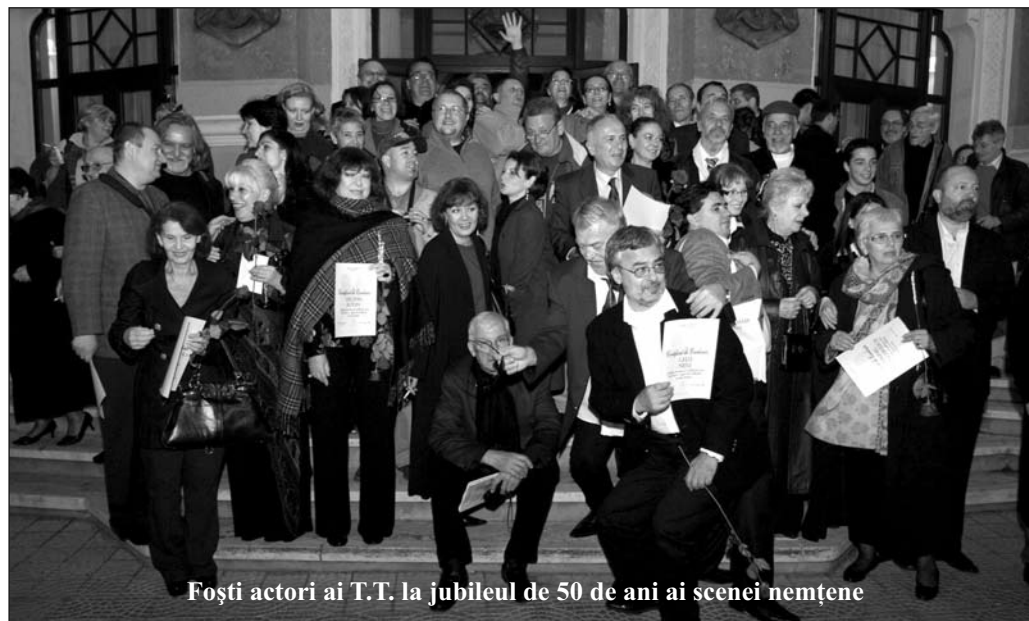
Foști actori ai T.T. la jubileul de 50 de ani ai scenei nemțene

ură ce doresc reluarea activității normale a instituției. Dar nu s-a întâmplat nimic și spectacolele de teatru se desfășoară în continuare în spații nepotrivite.