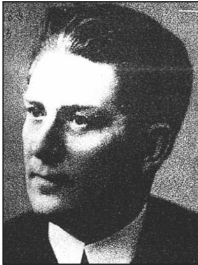
D. Gusti și reeditată în 1997, la Polirom Iași.

În galeria marilor personalități culturale românești, care au lucrat spornic la înălțarea și consolidarea coloanei înfrinse a învățământului românesc, un important loc îl ocupă sociologul, filosoful, eticianul, axiologul, publicistul PETRE ANDREI (29.06.1891, Brăila-4.10.1940, Iași), profesor strălucit al universității ieșene. A venit student la Iași în 1910, atras de faima lui Dimitrie Gusti (1880-1955), căruia, în 1915, îi va deveni student. În 1920, când acesta s-a transferat la București, i-a preluat sarcinile catedrei, devenind titular în 1922, cu sprijinul lui Garabet Ibrăileanu (1871-1936) și al lui Ion Petrovici (1882-1972). Între el și magistrul său Dimitrie Gusti s-au stabilit relații perene și rodnice. A acționat pe multe direcții pentru școala și învățământul românesc, pînă în ultima zi a vieții sale- 4 octombrie 1940, acum 65 de ani- cînd au venit să-l aresteze trei legionari înarmați cu pistoale. Ca să nu suporte umilințele și moartea în chinuri el a luat otravă, dinainte pregătită, după care își cerea iertare celor patru băieți minori: "Să mă iertați, dragii tații". A procedat eroic, ca și strămoșul erou, Decebal.