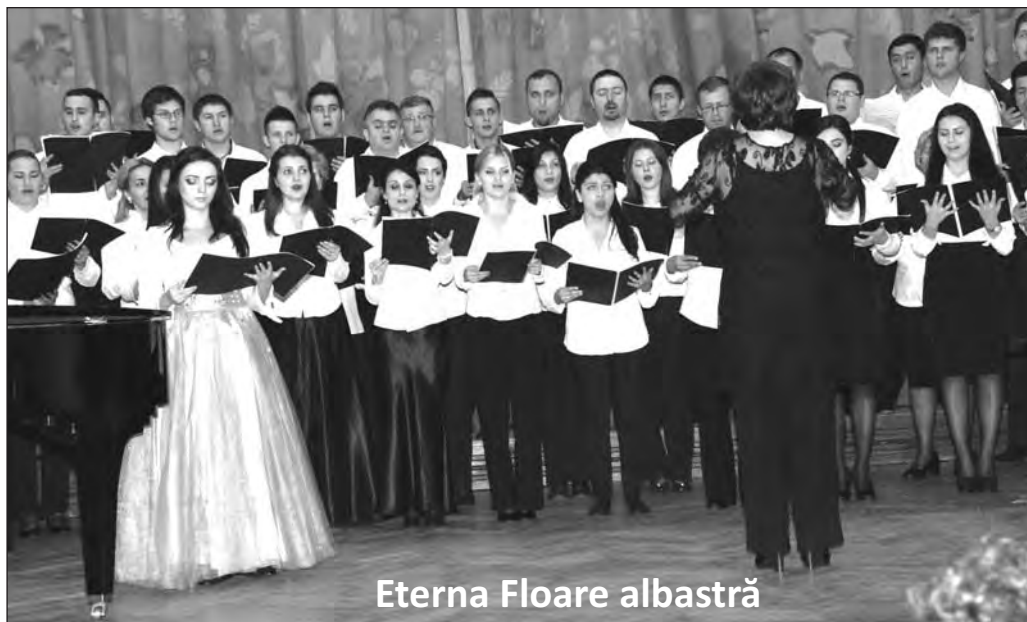
Eterna Floare albastră

N.R. Text scris pentru revista „Actualitatea muzicală” și citit în premieră la lansarea cărții la Piatra-Neamț