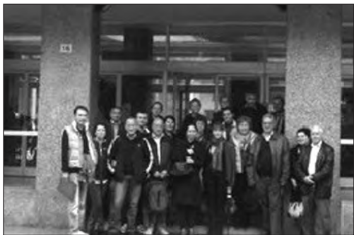
Activitatea 5.2: Organizarea a două vizite de studiu în Italia și Spania