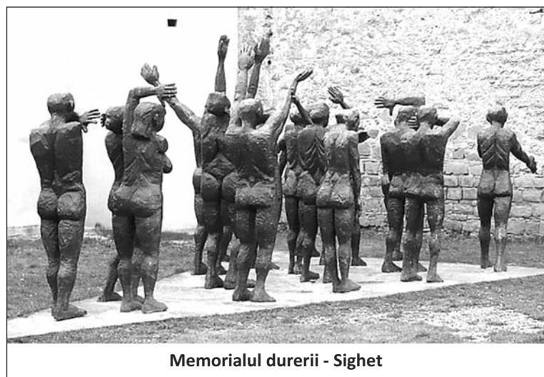
Memorialul durerii - Sighet

Totuși, beneficiind de un mare sprijin popular și fiind cel mai important lider al opoziției democratice, Maniu a continuat lupta cu comuniștii sperând într-o iluzorie susținere din partea Occidentului.