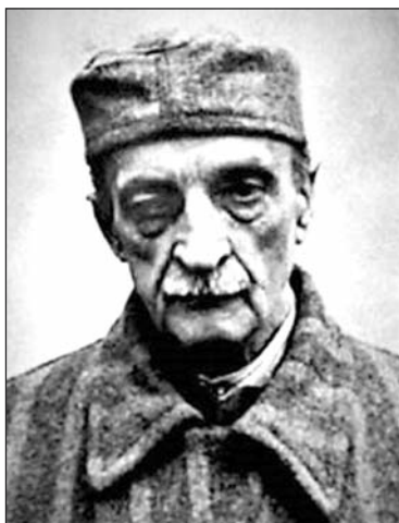
Din arhivele securității

R evenit la conducerea partidului în noiembrie 1937, Maniu va încheia un pact de neagresiune electorală cu Mișcarea Legionară și PNL – Gh. Brătianu, înțelegere mult criticată în epocă. Pactul nu însemna vreo abandonare a principiilor democratice și nici nu presupunea vreo colaborare politică după alegerile din decembrie 1937. Înțelegerea era valabilă doar pe perioada campaniei electorale și avea drept scop apărarea libertății și a corectitudinii alegerilor și