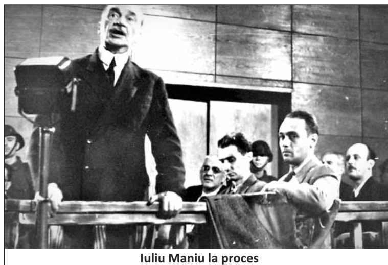
Iuliu Maniu la proces

În toamna anului 1918, Maniu se afla la Viena. Acolo, în condițiile declanșării revoluției, organizează și conduce legiunile românești care reușesc să asigure ordinea într-un oraș aflat în pragul anarhiei. La 14 noiembrie 1918 sosește la Arad, unde se desfășurau tratativele româno-maghiare. Intervenind, el i-a spus ministrului maghiar Jászi Oszkár că românii doresc să aibă propriul stat pe întreg teritoriul locuit de ei și l-a asigurat că drepturile celorlalte popoare vor fi respectate: „Noi nu voim să devenim din asupriți asu-