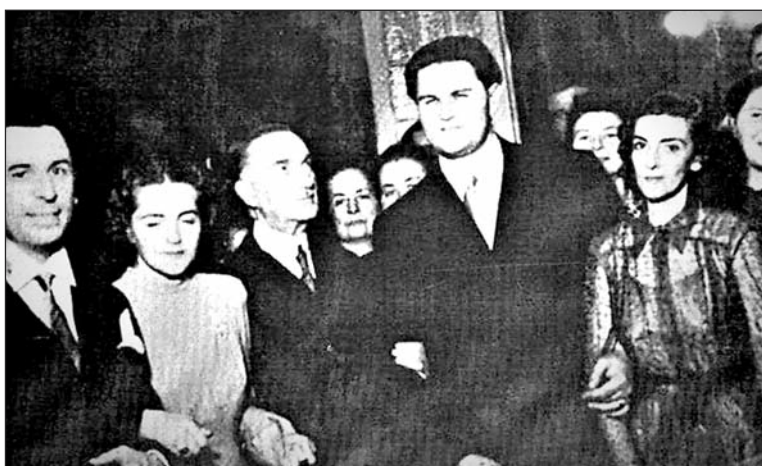
Iuliu Maniu la nunta lui Corneliu Coposu - octombrie 1942

La scurt timp după proclamarea lui Carol ca rege, Maniu își va da seama că speranțele sale fuseseră înșelate, suveranul încălcându-și promisiunile. În august 1930, după ce Elena Lupescu revenise în țară, Maniu îi declara regelui: „M-ați înșelat atât pe mine, cât și țara”. Din acel moment ruptura dintre cei doi va deveni inevitabilă, chiar dacă regele a mai făcut apel încă o dată la Maniu pentru o scurtă guvernare (octombrie 1932-ianuarie 1933). După ce-și depune demisia la 12 ianuarie 1933, demonstrând că nu se aștepta de putere ci rămâne fidel unor principii, Maniu se retrage din fruntea partidului. Rămâne însă un „soldat credincios” al acestuia și, mai ales, un critic vehement al tendințelor autoritare ale regelui și al camarilei regale din jurul Elenei Lupescu.