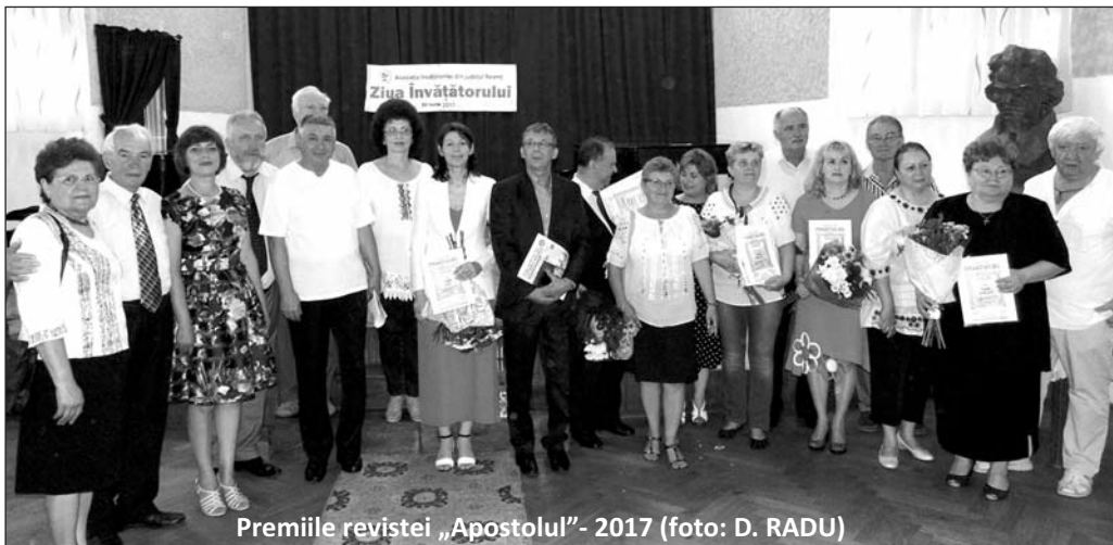
Premiile revistei „Apostolul” - 2017

Lecția de istorie □ Luna februarie □ Lecția de istorie □ Luna februarie □ Lecția de istorie □ Luna februarie