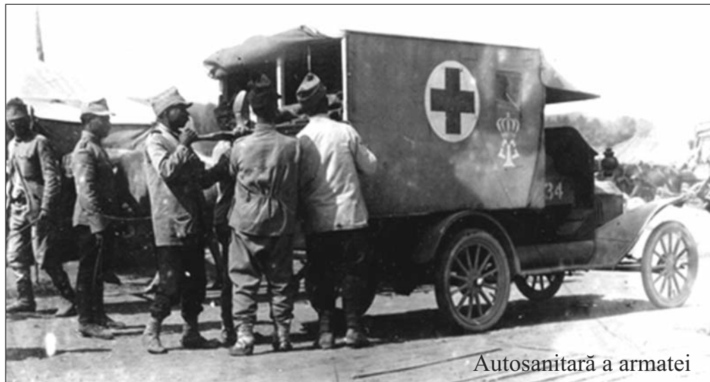
Autosanitară a armatei

O altă problemă cu care s-au confruntat spitalele și care s-a agravat la începutul anului 1917, era cea a igienei. O problemă mare în acest sens a fost despăducherea bolnavilor și răniților. Metoda folosită era spălarea cu petrol după care erau îmbăiați