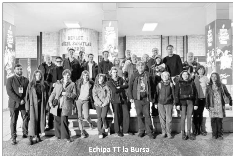
Echipa TT la Bursa

Pentru noi, această invitație a reprezentat oportunitatea de a juca, pe o scenă internațională, un spectacol validat prin aprecierea publicului și, totodată, prilejul de a fi reprezentați aproape în integralitate de trupa Teatrului Tineretului.