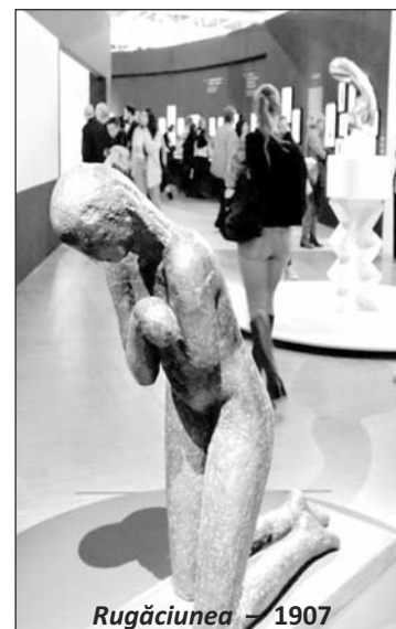
Rugăciunea – 1907

— Moștenirea fizică lăsată de artist țării – frumosul ansamblu de sculpturi de la Muzeul Național de Artă al României, acela de la Muzeul de Artă Craiova și mai ales An-