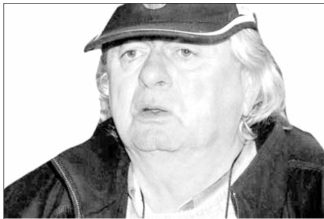
(26 nov.1943 – 24 apr. 2013)

că cel mai mult s-a străduit să-și acrediteze o imagine hâtră de țăran gârcinean ajuns „domn” la oraș. Era un lucru cu care se alinta perpetuu: eu, care sunt țăran de la Gârcina, i-am luat un