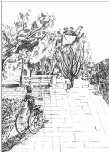
petiției, desfășurate pe două secțiuni – pictură și grafică. Expoziția a fost

Etapa competițională a cunoscut punctul final marți, 31 martie, când, la Sala Cupola a Bibliotecii Județene „G. T. Kirileanu” Neamț, a fost vernisată expoziția rezultată în urma concursului. Cu același prilej, au fost anunțate și rezultatele com-